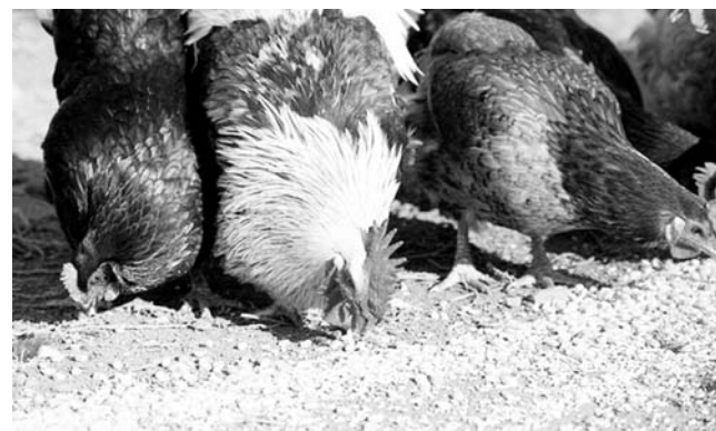
Ведущая полосы Л. ЕГОРОВА.

Зимой для улучшения пищеварения птицы в отдельном ящике обязательно насыпайте гравий и камешки. Воду в этот период лучше давать теплую.